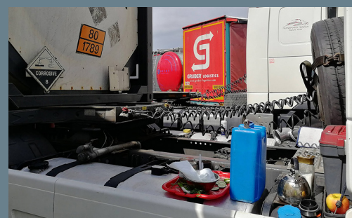
Lkw-Fahrende nutzen die Anhänger als improvisierte Küchen – egal ob darauf ein Auto oder Gefahrgut geladen ist.