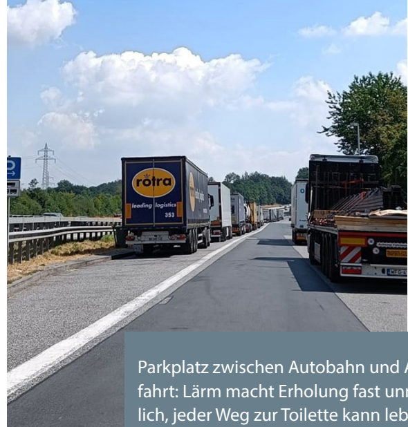
Parkplatz zwischen Autobahn und Auffahrt: Lärm macht Erholung fast unmöglich, jeder Weg zur Toilette kann lebensgefährlich sein.

10. Zur mangelhaften Erholung trägt auch das Fehlen an Freizeitangeboten und Kommunikationsinfrastruktur bei, wie Sportgeräte oder kostenloses WLAN.