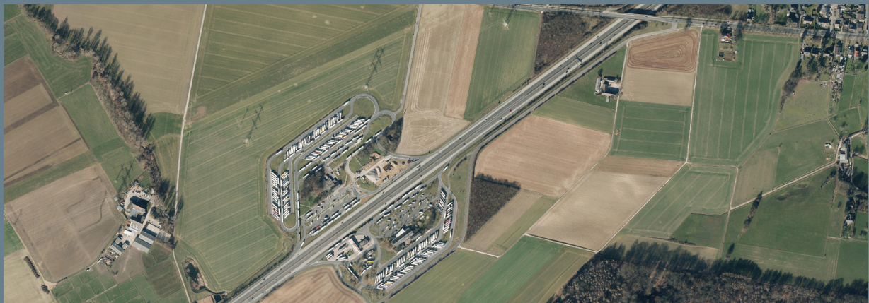
Luftaufnahme der Rastanlagen Aachner Land.

Mit vergleichsweise geringem Aufwand könnten Parkplätze an bereits bestehenden Rastanlagen andersherum angeordnet werden, sodass die Anhänger Richtung Lärm stehen und die Fahrer davon abgewandt ruhiger schlafen können.